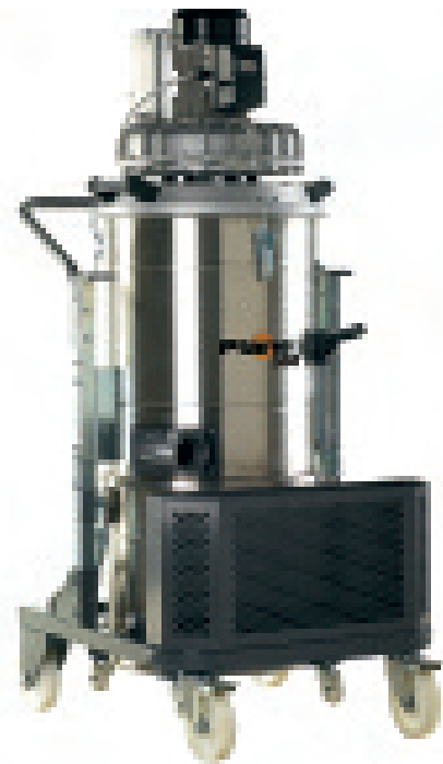
PLANET 300 SC