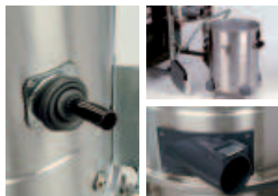
Options type 1